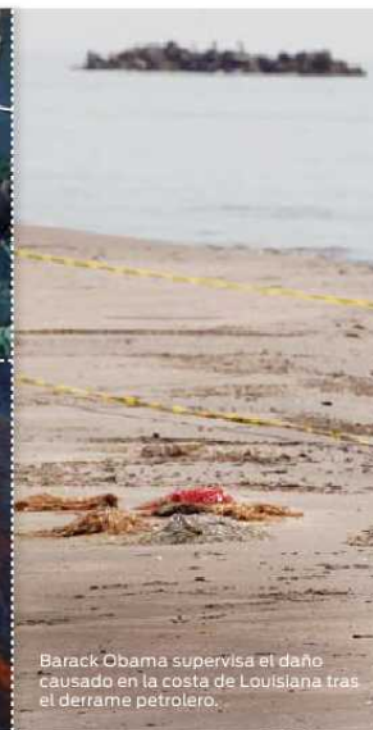
Barack Obama supervisa el daño causado en la costa de Louisiana tras el derrame petrolero.