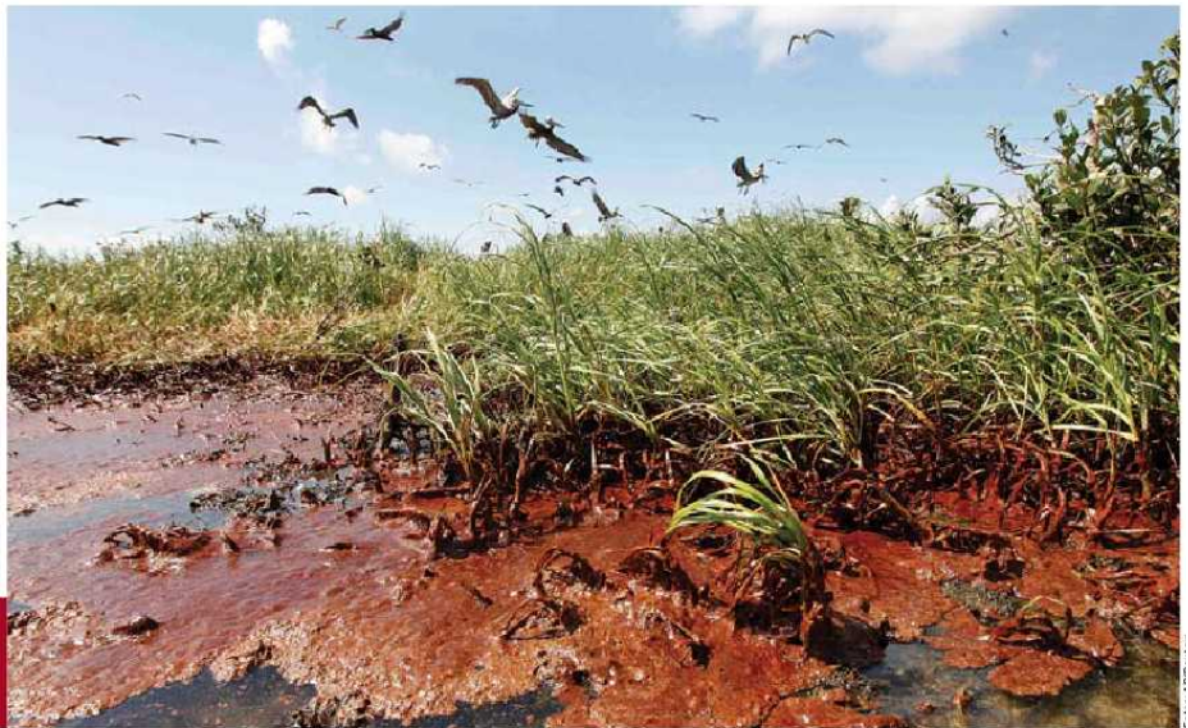
Pelícanos de la costa de Louisiana se ven afectados.

do su absorción de oxígeno, limitando sus movimientos y eventualmente matándolos. Es por ello que un animal atrapado en estos pozos rara vez puede escapar de ellos y queda capturado (como lo muestra el museo de sitio de La Brea, en California).