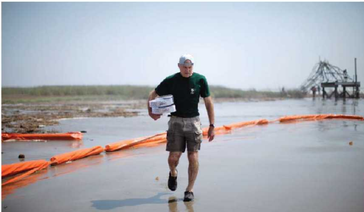
Un proteccionista transporta equipo que se utilizará para limpiar.

En el modelo teórico, la solución va por una de tres vías: 1.- Se definen claramente los derechos de propiedad (la explotación pesquera es superior a la explotación